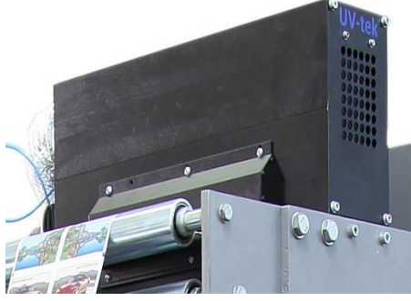
UV KURUTMA ÜNİTESİ VE FAN