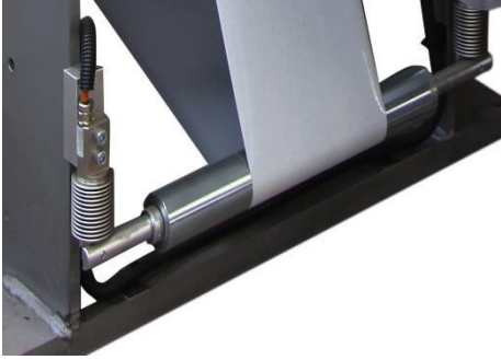
TANSYON RULO ÜNİTESİ