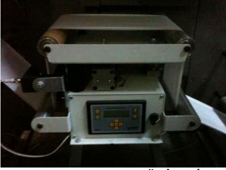
KENER KONTROL ÜNİTESİ