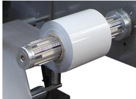
DOBLE PNEUMATİK HAVA ŞAFTI