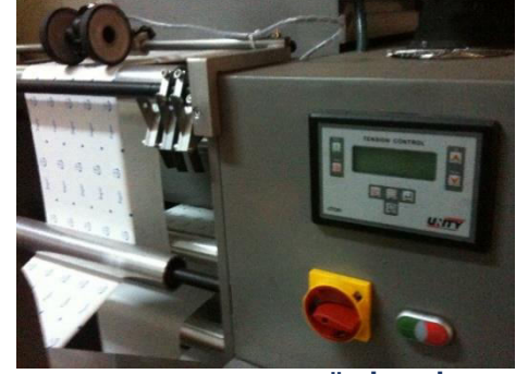
TANSYON RULO ÜNİTESİ