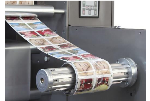
DOBLE PNEUMATİK HAVA ŞAFTI